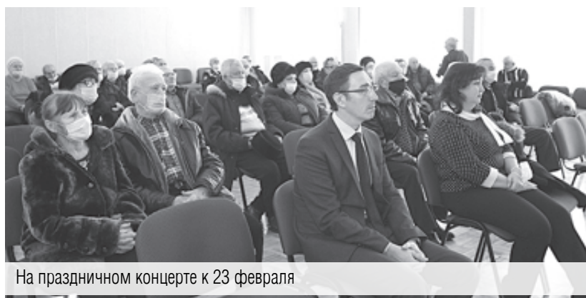
На праздничном концерте к 23 февраля

мировича за поддержку в период пандемии, – отмечают жители дома № 53 по улице 50-летия Магнитки. – Постоянно привозили продуктовые наборы, которые были нам так необходимы. Приятно, что не оставили нас без внимания. Рады, что вы работаете именно в нашем округе. Некоторые из жителей микрорайона хотели, но не могли получить газеты. С поддержкой депутата нам удалось выписать особо нуждающимся газеты «Магнитогорский металл» и «Магнитогорский рабочий».