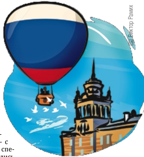
Иллюстрация: Виктор Рахим

– Мы в восхождениях нечасто поднимаемся с государственным флагом, обычно – с вымпелом. А восемь лет назад специально к Дню флага РФ поднялись на Эльбрус с северной стороны. Было сложно. И вспоминается другое, тоже очень тяжёлое восхождение с флагом: в 1997 году, на одну из самых красивых гор Патагонии между Аргентиной и Чили – Фицрой, высота 3405 метров. В команде нас пятеро, гора встретила снегопадом, поднимались целый месяц, добрались с четвёртой попытки. В тот сезон мы единственные достигли цели, а вообще – были первыми среди россиян и стали чемпионами России в техническом классе.