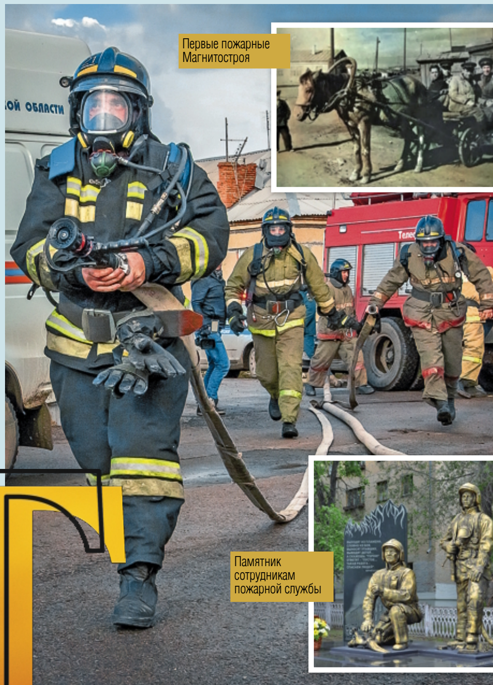
Первые пожарные Магнитостроя