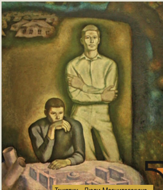
Триптих «Люди Магнитогорска»