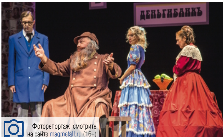
Фоторепортаж смотрите на сайте magmetall.ru (16+)

Пьеса о выборе между сердцем и кошельком, написанная в 1871 году, актуальна и сегодня