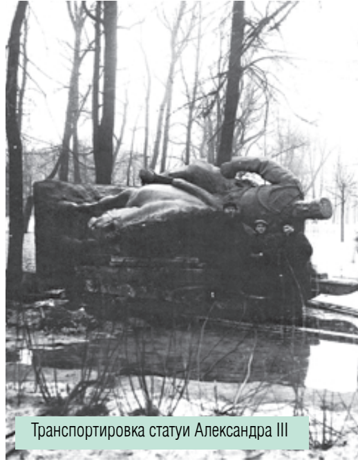
Транспортировка статуи Александра III

Корни дуба-долгожителя в прямом и переносном смысле уходят к Петровским временам