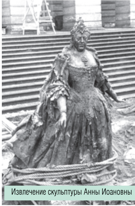
Извлечение скульптуры Анны Иоановны