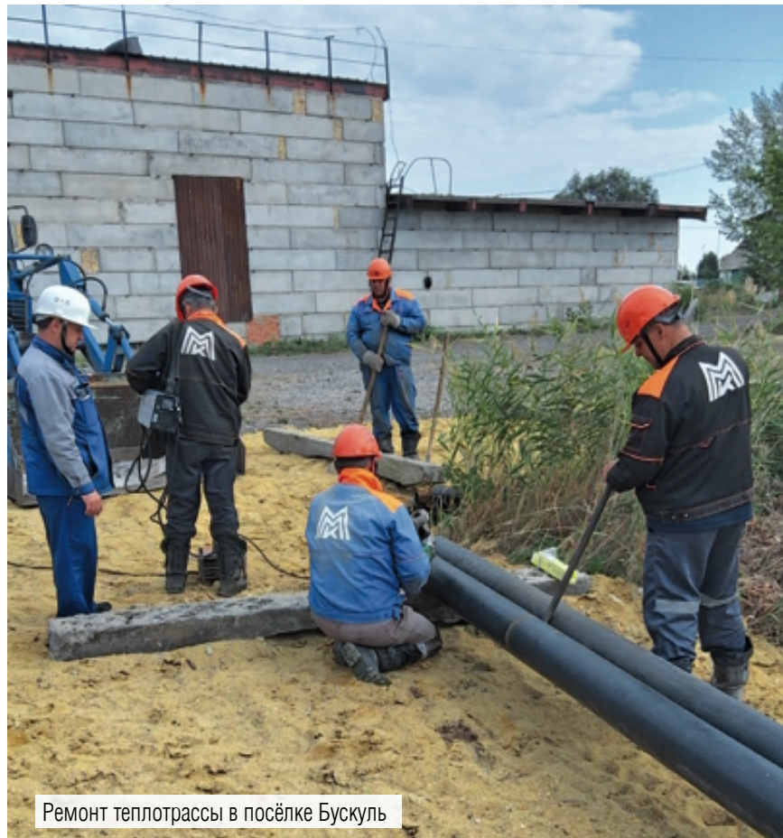
Ремонт теплотрассы в посёлке Бускуль

На протяжении всей своей истории ПАО «ММК» конкретными делами подтверждает звание социально ориентированного предприятия