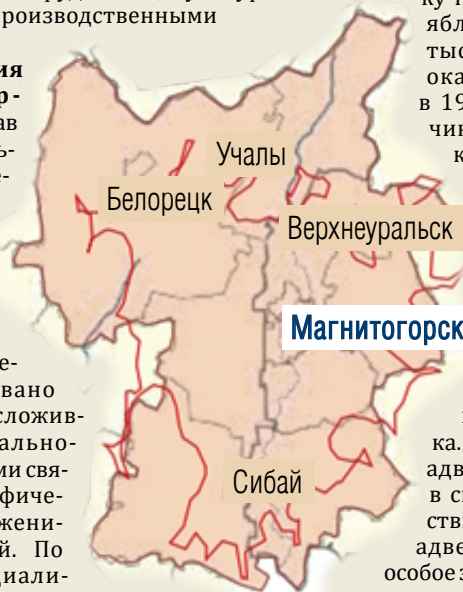
Границы Магнитогорской агломерации