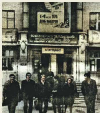
Агитпункт, Магнитогорск. 1970 г.

металлургии является основным железорудным сырьём для получения чугуна в доменной печи. При производстве агломерата основными компонентами аглошихты являются железорудные концентраты,