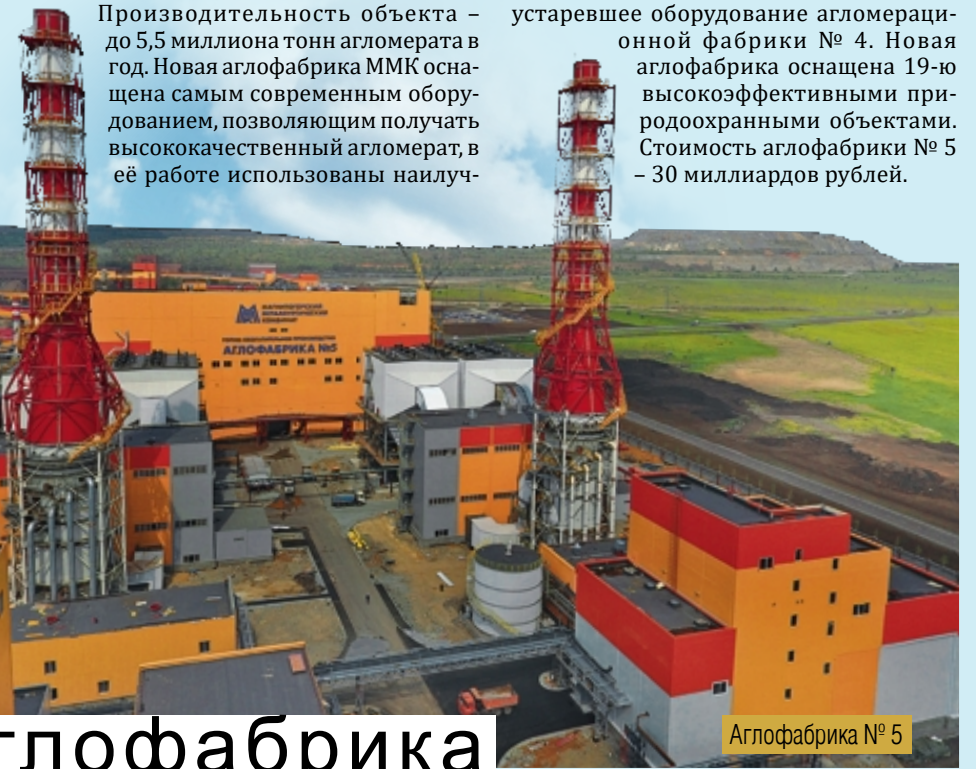
Аглофабрика № 5