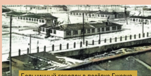
Больничные городок в посёлке Ежовка

гаду слесарей-сварщиков металлических конструкций, монтировавшую металлоконструкции в жилых домах и на объектах соцкультбыта, алюминиевые конструкции витражей. Принимал участие в строительстве медсанчасти треста «Магнитстрой», ДК металлургов имени С. Орджоникидзе, крытого рынка, цирка, Ледового дворца, ДС «Строитель», кинотеатра «Магнит», картинной галереи. Избирался депутатом Правобережного Совета народных депутатов Магнитогорска, членом окружной избирательной комиссии по выборам в Совет Национальностей Верховного Совета СССР, инспектором по охране труда. Награждён орденом «Знак Почёта», отмечен знаком «Отличник по охране труда Минтяжстроя СССР».