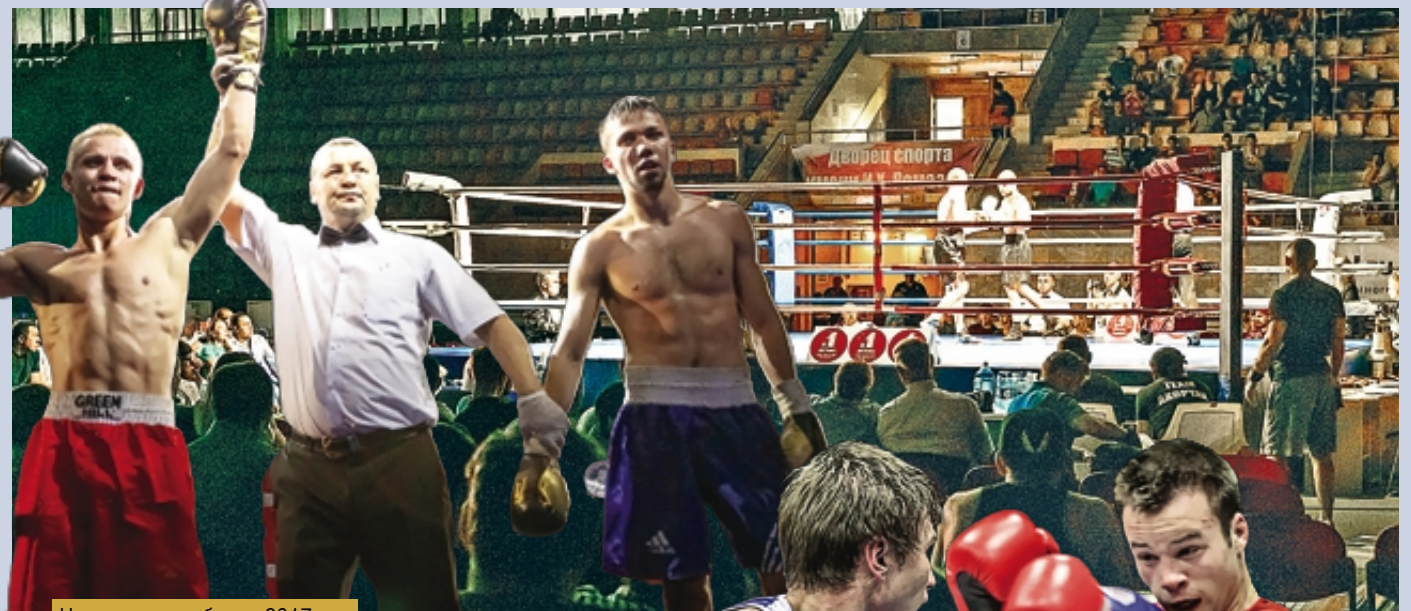
Чемпионат по боксу, 2017 год