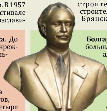
ГЕОРГИЙ ДИМИТРОВ 1882–1949

Больница Магнитогорска. До 1947 года все медицинские учреждения города, в том числе и больницы, размещались во временных помещениях – бараках. В начале 1932 года на Ежовке была построена Центральная больница, которая имела одиннадцать лечебных корпусов, семь подсобных, в том числе четыре двухэтажных дома для персонала. В больничном городке было