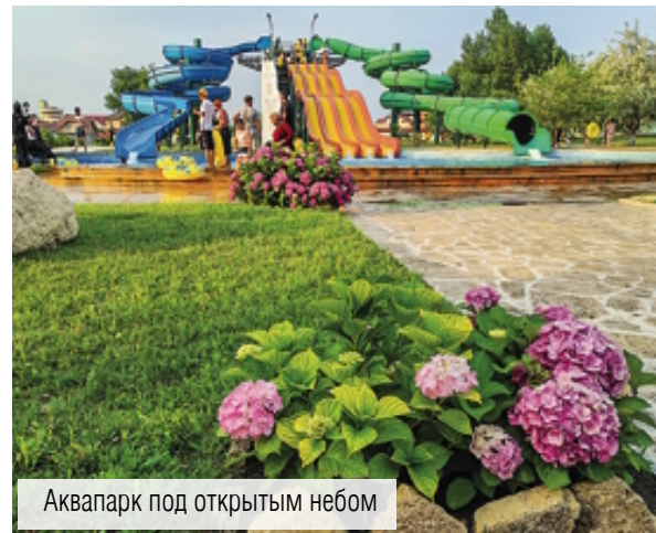
Аквапарк под открытым небом