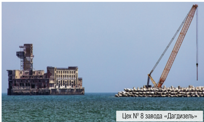
Цех № 8 завода «Дагдизель»