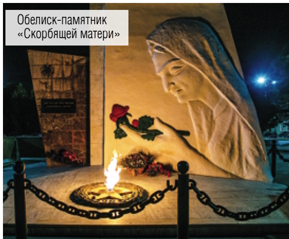
Обелиск-памятник «Скорбящей матери»