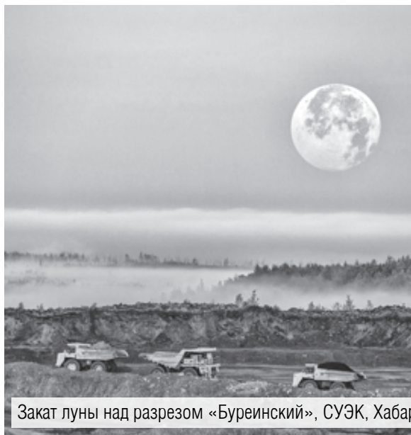
Закат луны над разрезом «Буреинский», СУЭК, Хабаровский край