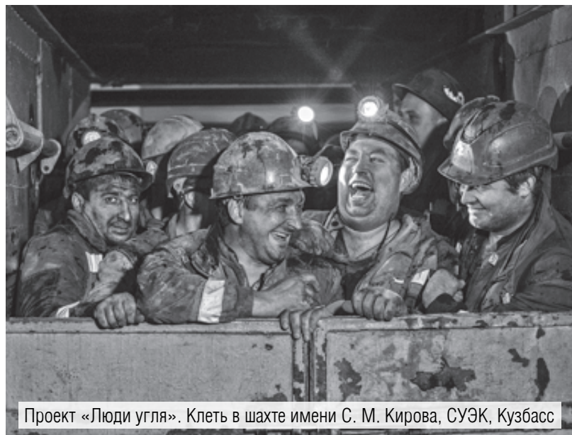
Проект «Люди угля». Клеть в шахте имени С. М. Кирова, СУЭК, Кузбасс