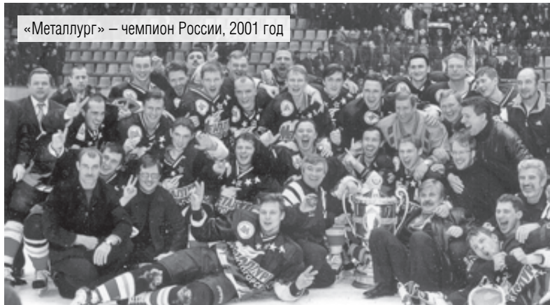
«Металлург» – чемпион России, 2001 год

В самом начале календарной зимы наша страна отмечает Всероссийский день хоккея