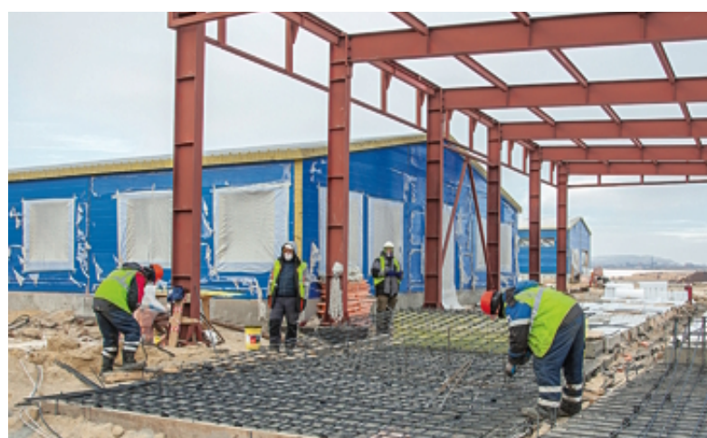
Строительство мусоросортировочного полигона