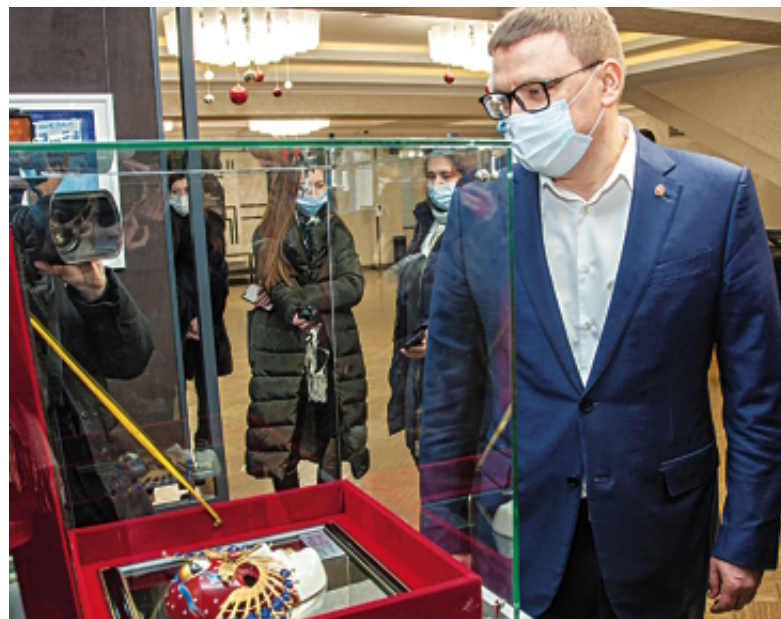
«Золотая маска» театра имени Пушкина