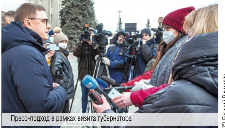
Пресс-подход в рамках визита губернатора