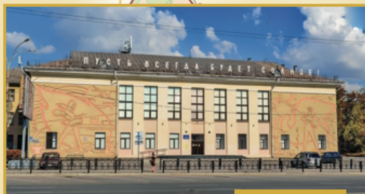
Дворец творчества детей и молодёжи Пр. Ленина, 59