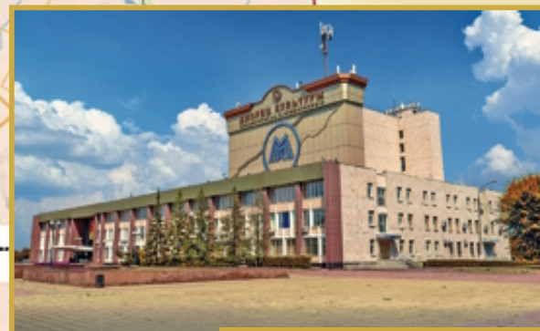
Дворец культуры металлургов имени Серго Орджоникидзе Ул. Набережная, 1