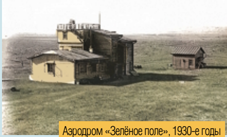
Аэродром «Зелёное поле», 1930-е годы