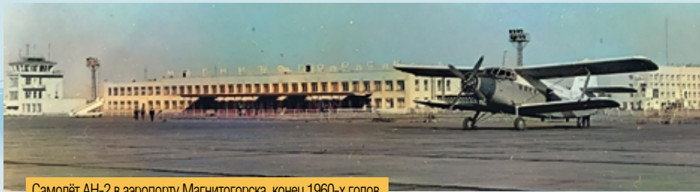
Самолёт АН-2 в аэропорту Магнитогорска, конец 1960-х годов