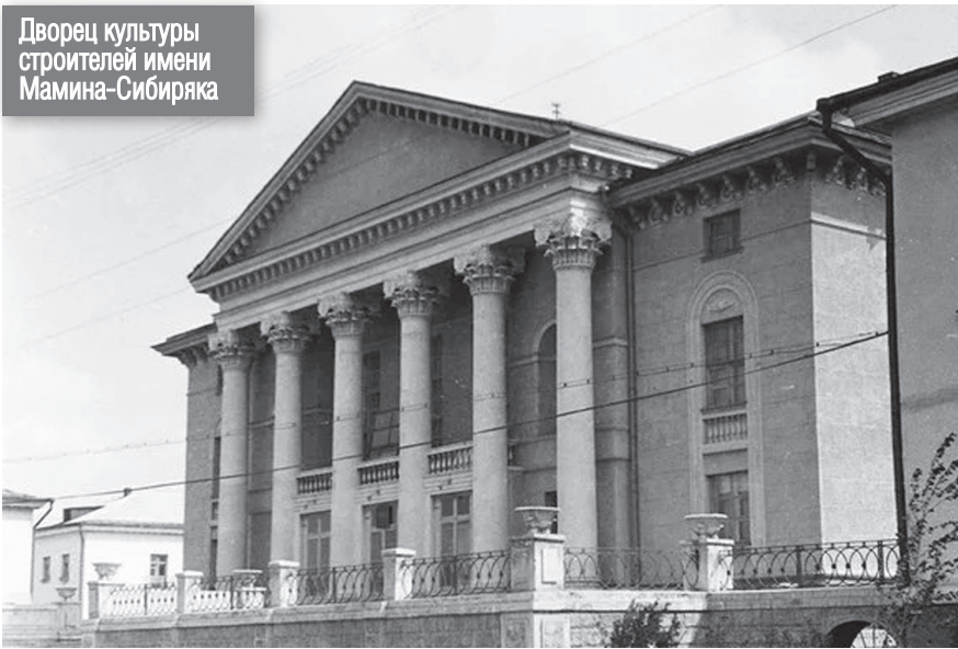
Дворец культуры строителей имени Мамина-Сибиряка

ЖДТ, горняков, строителей, трудовых резервов, и всего один Дворец культуры – левобережный. 31 декабря 1952 года был открыт Дворец культуры строителей имени Мамина-Сибиряка на правом берегу. Дети со всех районов бежали туда, чтобы заниматься в кружках: театральном, танцевальном, хоровом, драматическом, рукодельном. Работали с ними талантливые преподаватели, настоящие профессионалы. Сколько они воспитали хороших, добрых ребят, дали им профессию на всю жизнь.