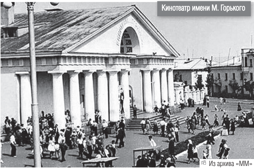
Кинотеатр имени М. Горького

Концерт состоится в субботу, 31 января, в 16.00. Вход свободный.