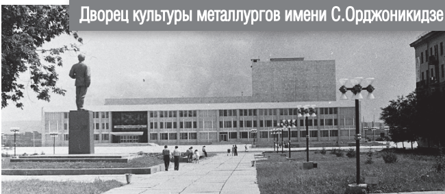
Дворец культуры металлургов имени С.Орджоникидзе