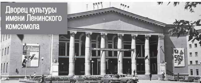
Дворец культуры имени Ленинского комсомола