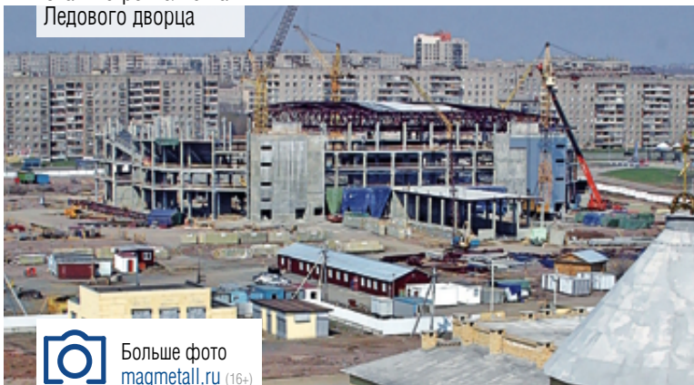
Больше фото magmetall.ru (16+)