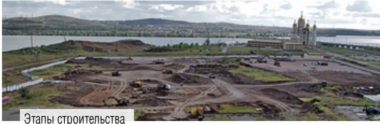
Этапы строительства Ледового дворца