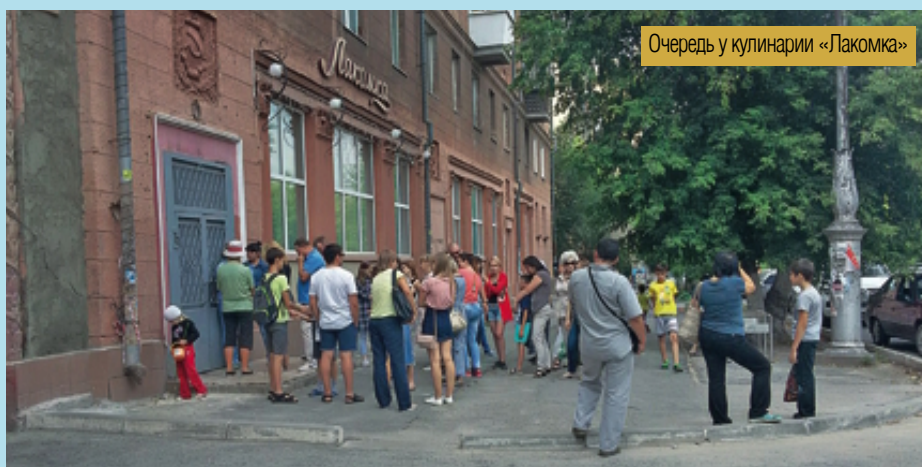
Очередь у кулинарии «Лакомка»