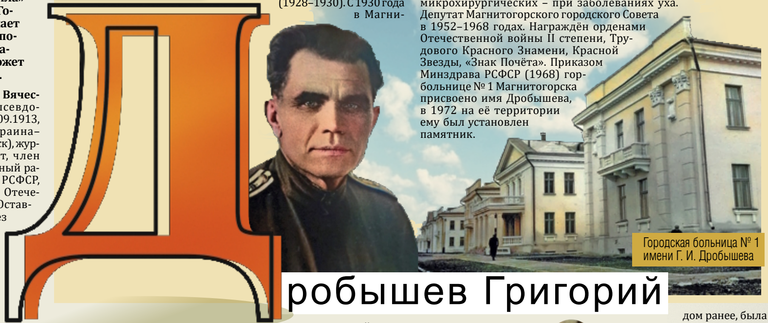
Городская больница № 1 имени Г. И. Дробышева