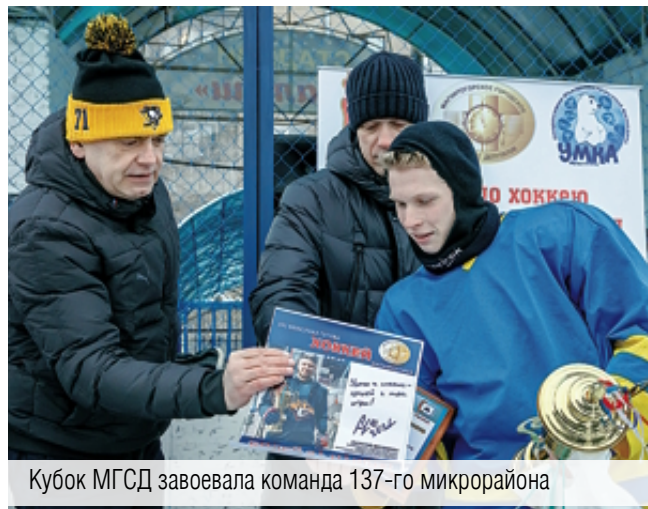
Кубок МГСД завоевала команда 137-го микрорайона