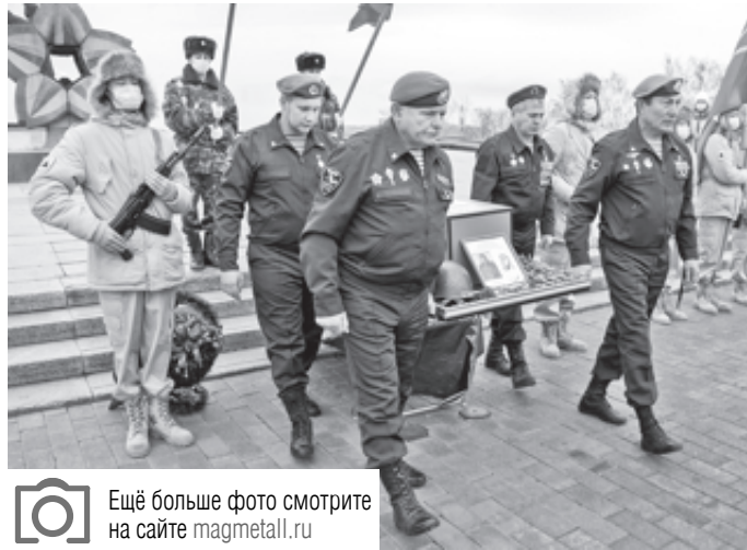
Ещё больше фото смотрите на сайте magmetall.ru