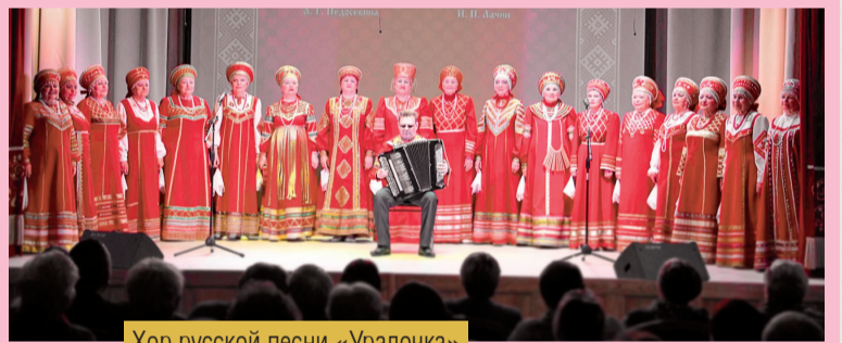
Хор русской песни «Уралочка»