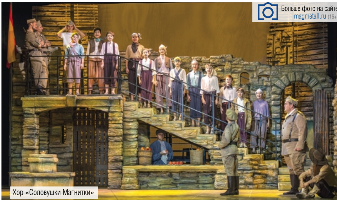
Хор «Соловухи Магнитки»