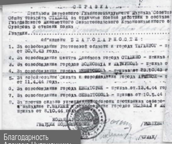
Благодарность Алексею Цуприяничика