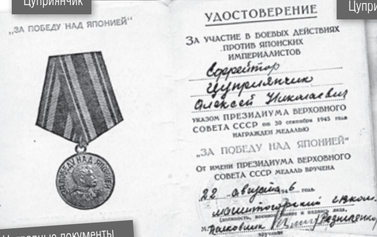
Наградные документы Алексея Цуприяничика