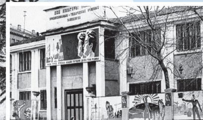
Дом культуры трудовых резервов

В начале января 1947 года, в преддверии пятнадцатилетия ММК, «ММ» обратился к читателям с просьбой присылать в редакцию воспоминания о начале строительства Магнитогорского металлургического комбината, а также о наиболее выдающихся людях и событиях из жизни предприятия.