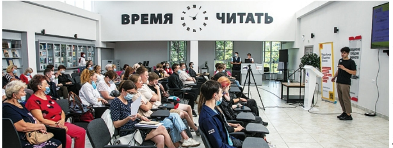
Из архива «ММ», Евгений Рухманов