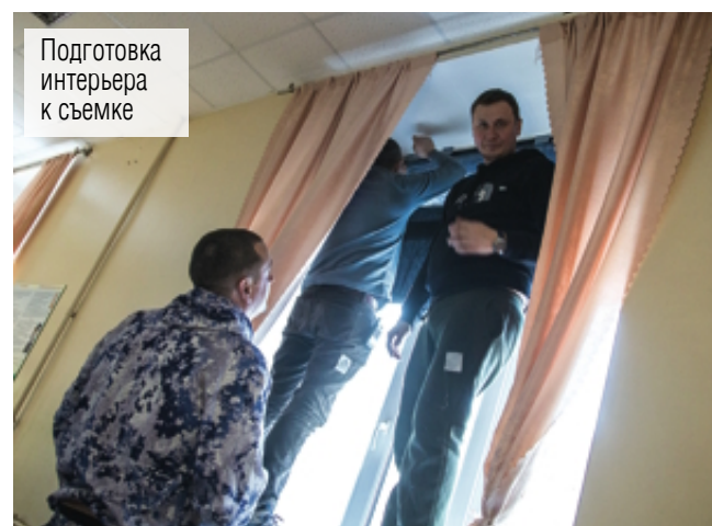
Подготовка интерьера к съёмке