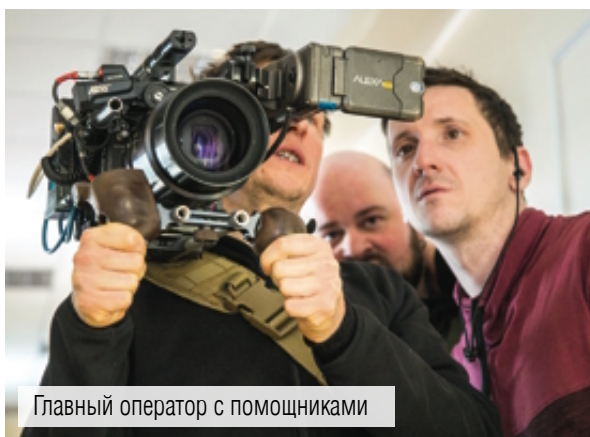
Главный оператор с помощниками