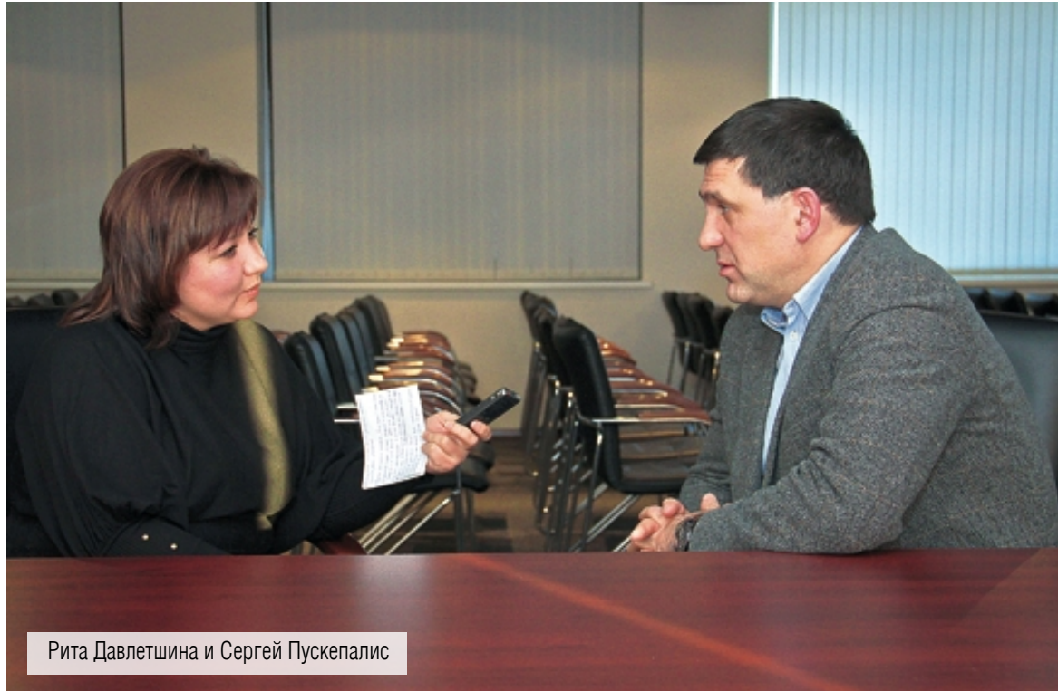
Рита Давлетшина и Сергей Пускепалис

Смерть актёра, режиссёра, политического и общественного деятеля Сергея Пускепалиса ошеломила многих россиян