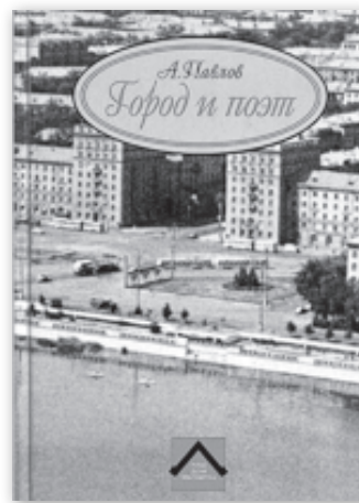
Книга «Город и поэт»

Гудело пламя, взламывая танк, томилось небо без дождя и вздоха... В копровом цехе вечный кавардак, в пролётах тесных стиснута эпоха!