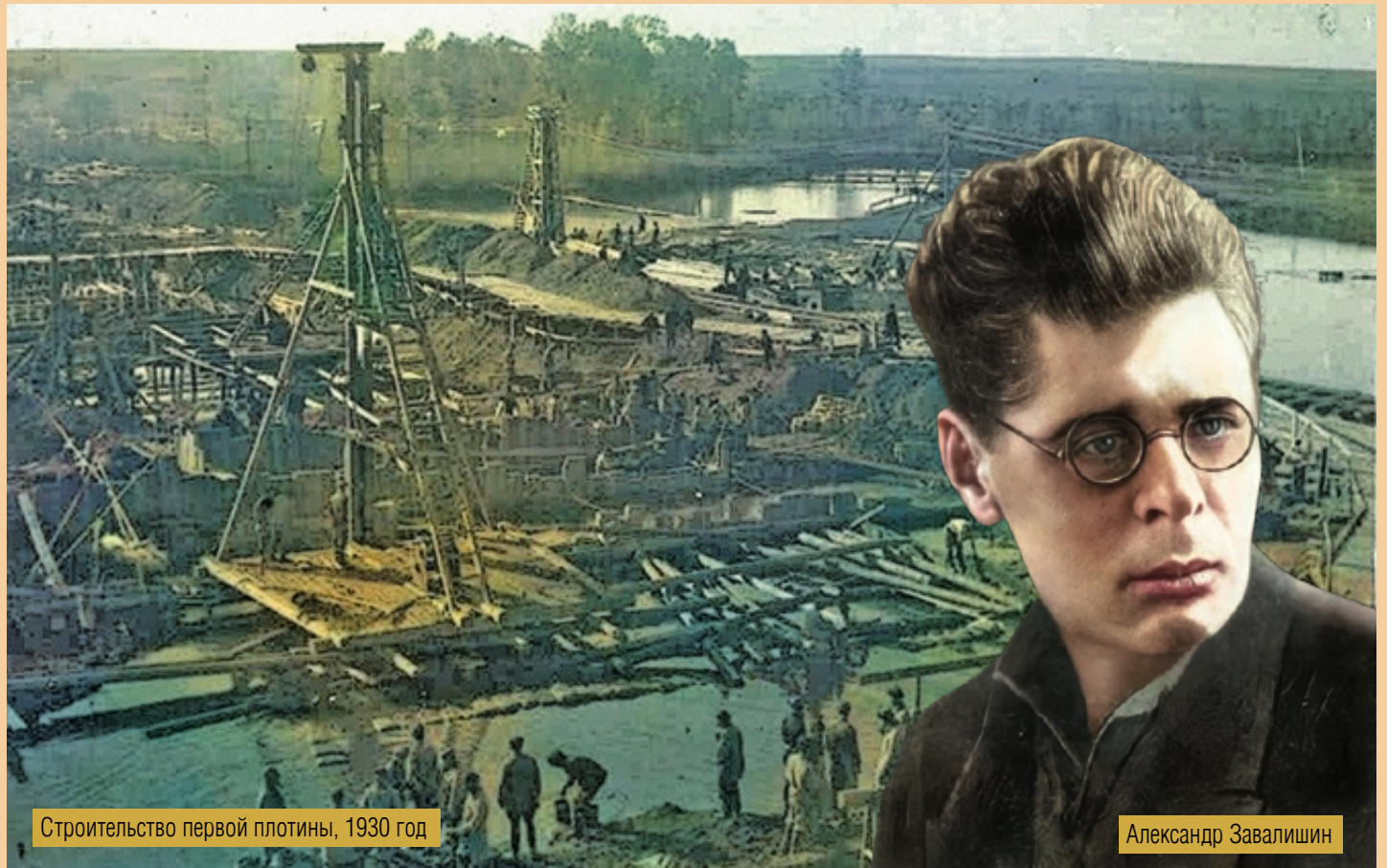
Строительство первой плотины, 1930 год