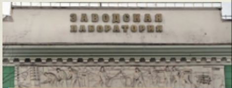
Рельефный фриз на фасаде центральной лаборатории ММК