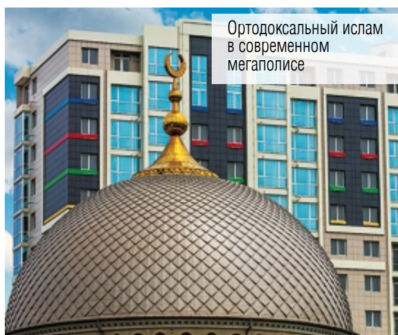
Ортодоксальный ислам в современном мегаполисе