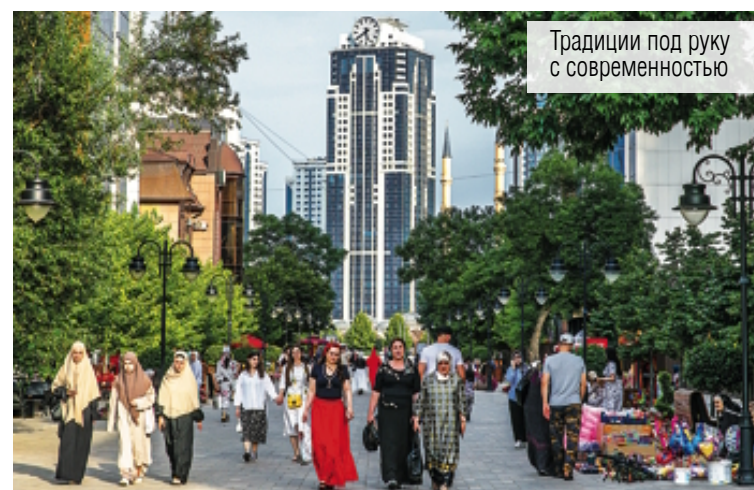
Традиции под руку с современностью