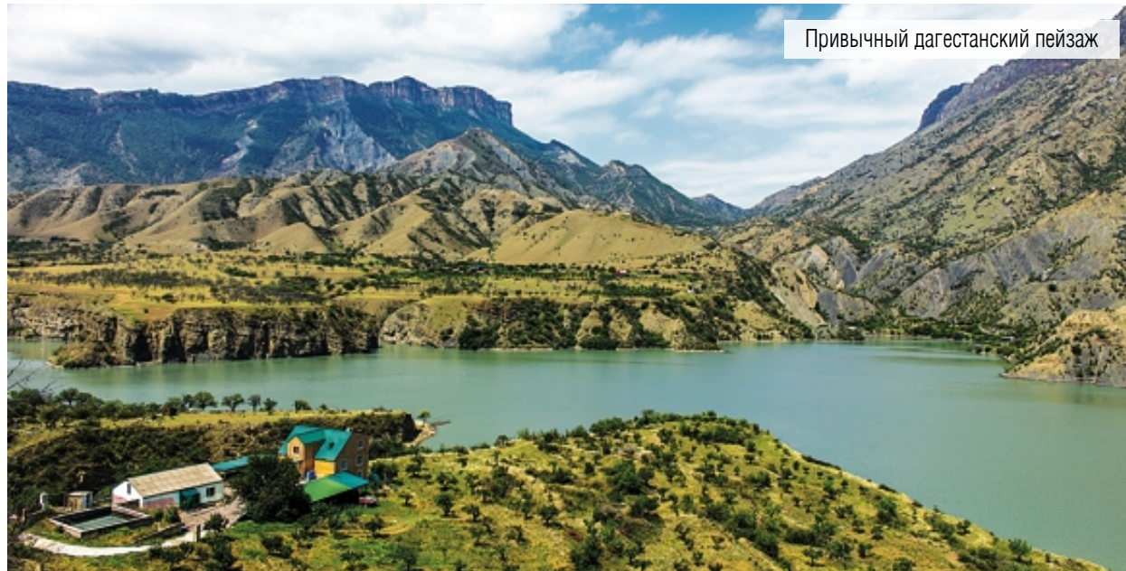
Привычный дагестанский пейзаж