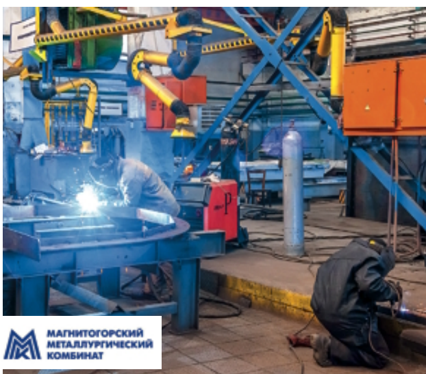
МАГНИТОГОРСКИЙ МЕТАЛЛУРГИЧЕСКИЙ КОМБИНАТ