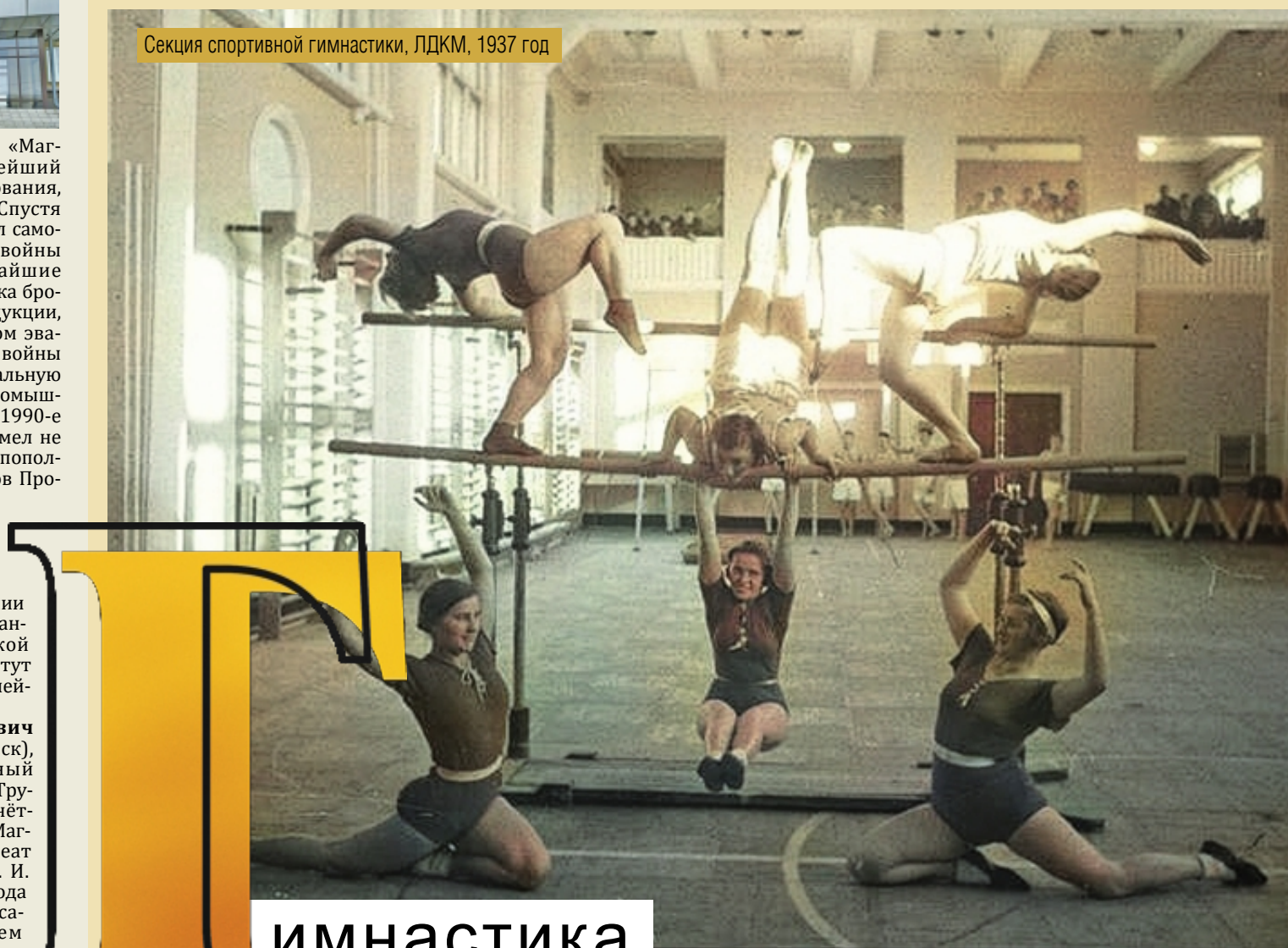
Секция спортивной гимнастики, ЛДКМ, 1937 год