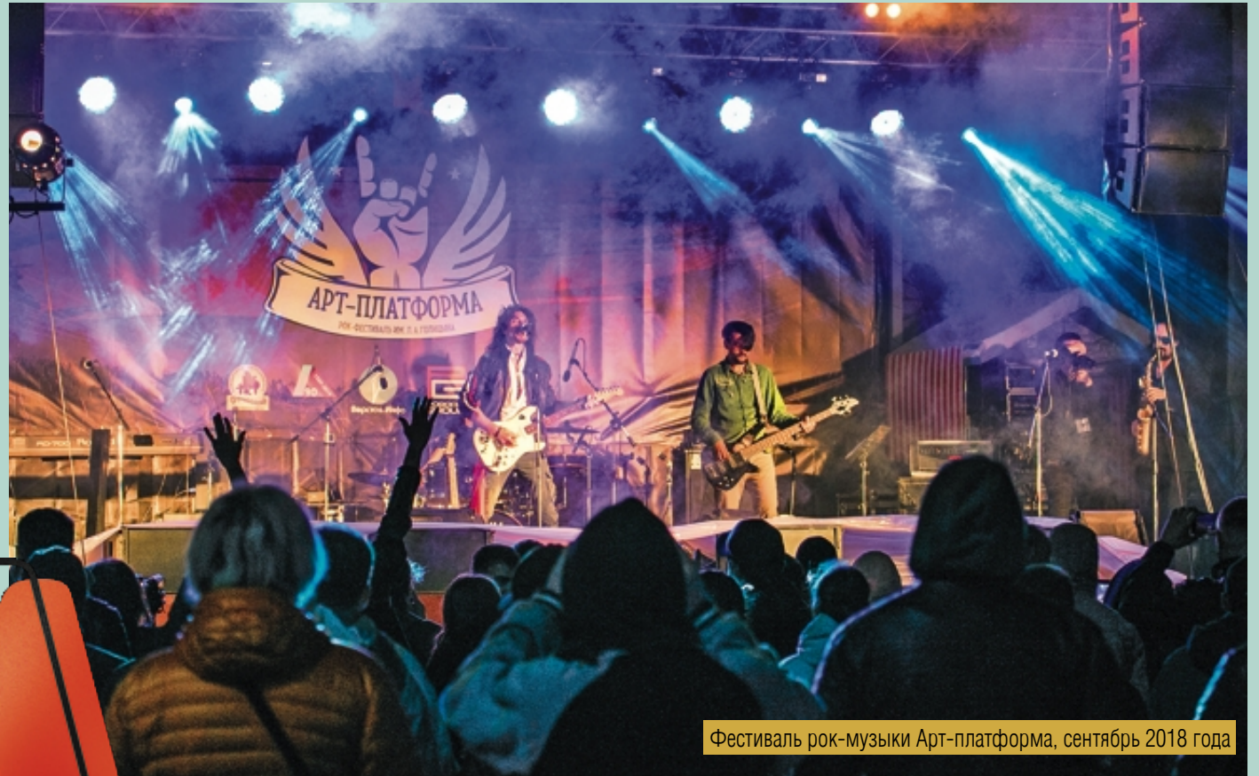
Фестиваль рок-музыки Арт-платформа, сентябрь 2018 года