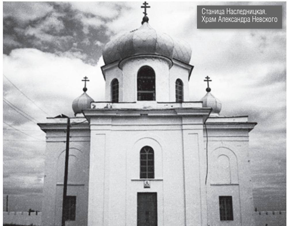
Станица Наследницкая. Храм Александра Невского