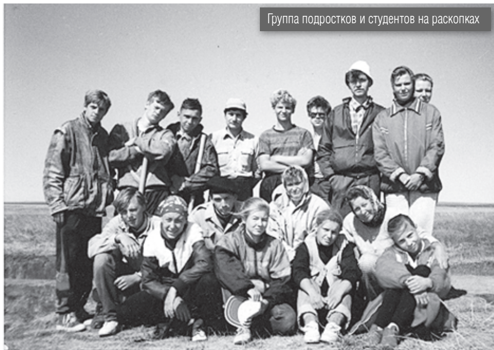
Группа подростков и студентов на раскопках