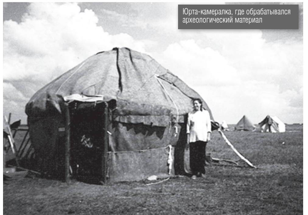
Юрта-камералка, где обрабатывался археологический материал