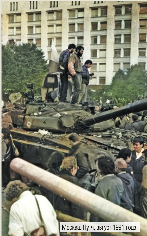
Москва. Путч, август 1991 года