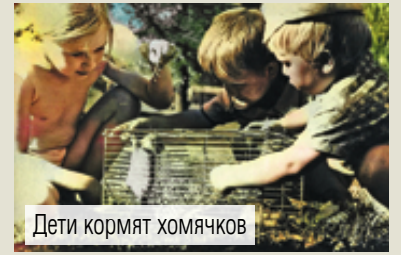
Дети кормят хомячков