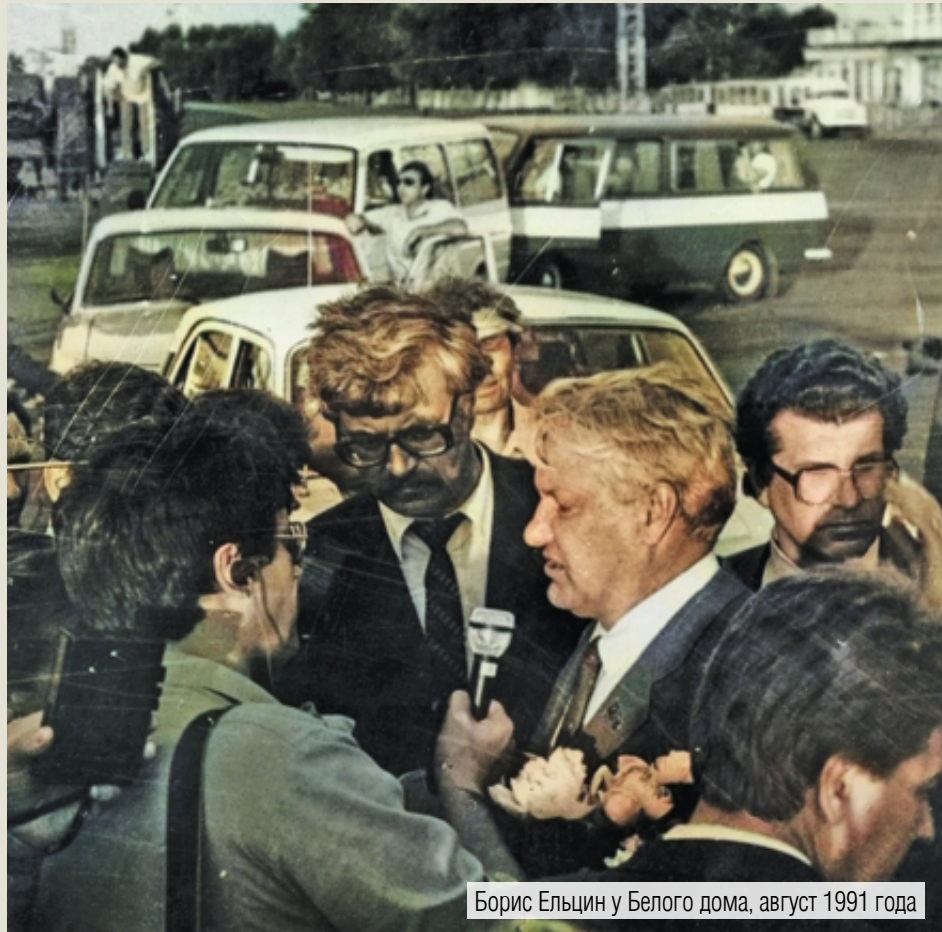
Борис Ельцин у Белого дома, август 1991 года