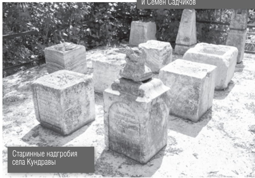
Старинные надгробия села Кундравы