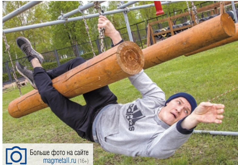
Больше фото на сайте magmetall.ru (16+)

На Центральном стадионе соревновались в силе, ловкости и выносливости