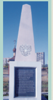
Памятник И. И. Мистрову в посёлке Старая Магнитка

Иванович Мистров. Судьба первого оказалась трагичной: он был казнён Емельяном Пугачёвым. Комендант Мистров управлял дистанцией почти двадцать лет и оставил о себе добрую память. Внимательный, добрый и чуткий, он был строгим, но справедливым начальником. Ни одно событие не оставило его равнодушным. Благих дел на счету коменданта И. И. Мистрова было немало. Казаки, отмечая отеческую заботу коменданта, на пожертвования жителей поставили на площади перед церковью колонну (стелу) из простого кирпича, на которой закрепили чугунную плиту. Она до сих пор хранится в Магнитогорском краеведческом музее. В 2005 году на месте старого казачьего кладбища был построен мемориальный комплекс в память о казаках – жителях станции Магнитной. В составе комплекса и восстановленный памятник-стела коменданту крепости Магнитной и Магнитной дистанции генералу Ивану Ивановичу Мистрову.