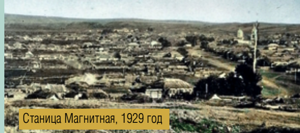
Станция Магнитная, 1929 год

бург. Над ними стоял генерал-губернатор. 3 мая 1835 года должность комендантов крепостей была упразднена, их обязанности были возложены на казачьих офицеров.