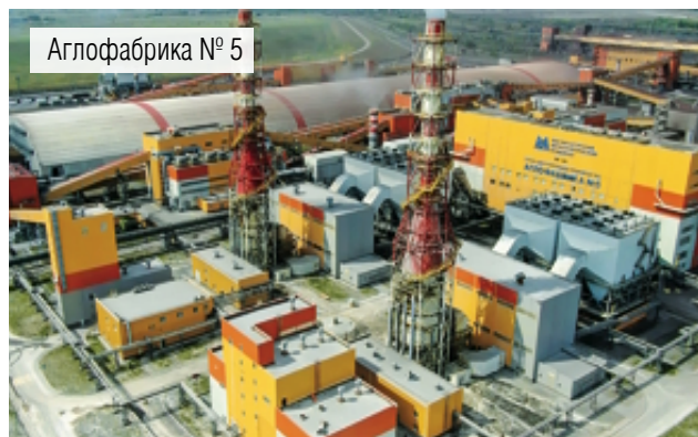
Аглофабрика № 5

В аглоцехе Магнитогорского металлургического комбината по итогам 2021 года произведено 11 388,9 тысячи тонн агломерата – основного компонента шихты доменных печей. Для агломерационного производства ММК, которое отметит в наступившем году своё 85-летие, это рекордный показатель с 1989 года.