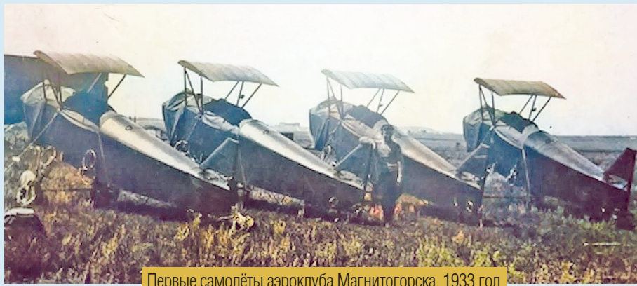
Первые самолёты аэроклуба Магнитогорска, 1933 год

Аэродромная – улица левобережья, последняя перед выездом на Челябинский тракт.