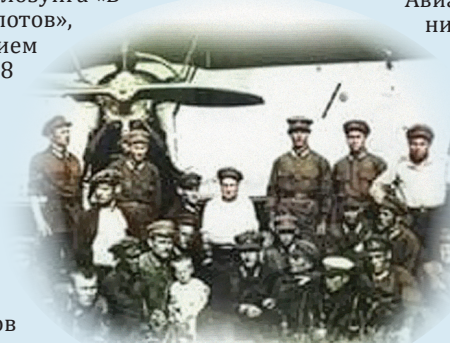
Лётчики и курсанты, 1930–1940-е годы