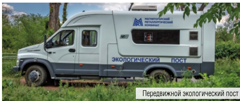
Передвижной экологический пост

Ранее на территории Магнитогорска функционировали два стационарных эколопоста – у Дворца культуры метал-