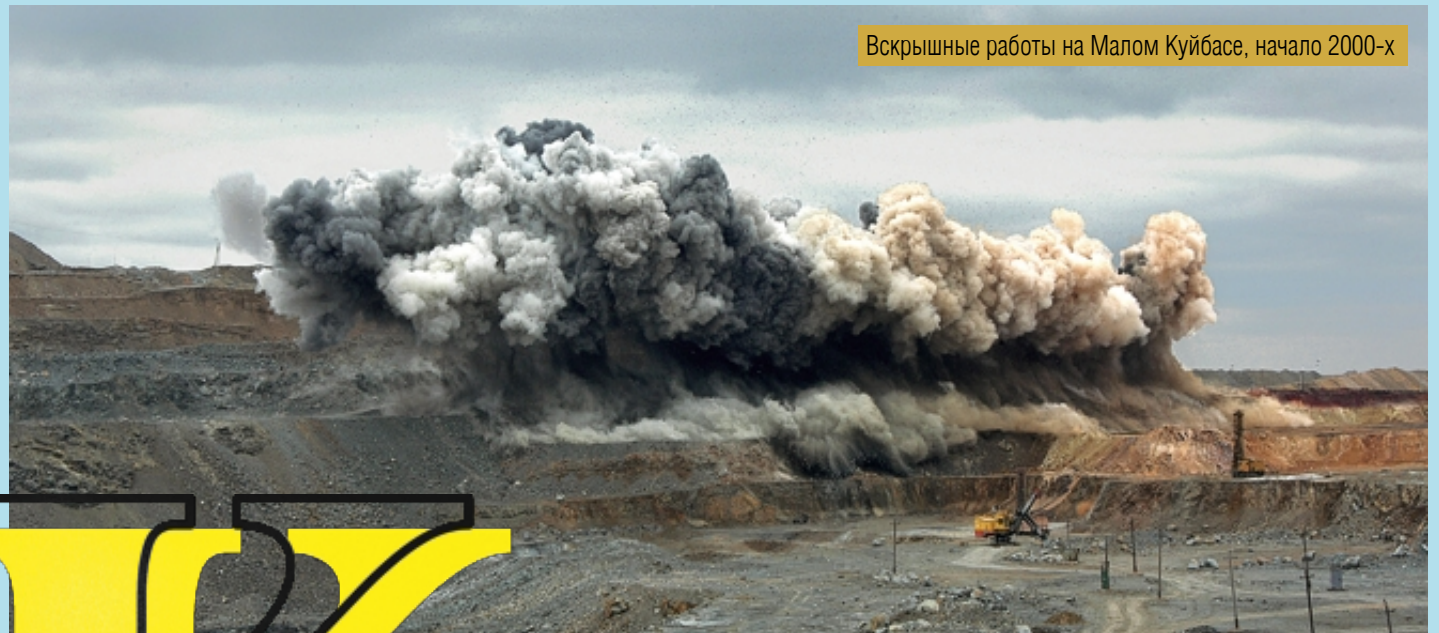
Вскрышные работы на Малом Куйбасе, начало 2000-х