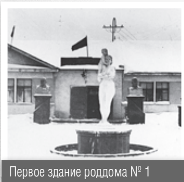
Первое здание роддома № 1