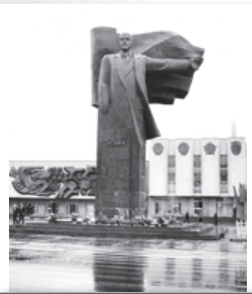
Памятник В. И. Ленину на Комсомольской площади