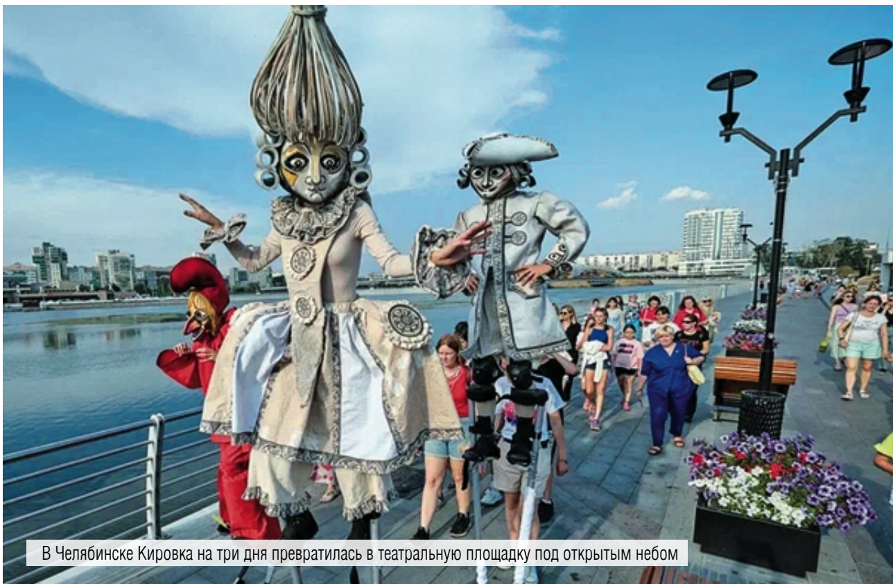
В Челябинске Кировка на три дня превратилась в театральную площадку под открытым небом