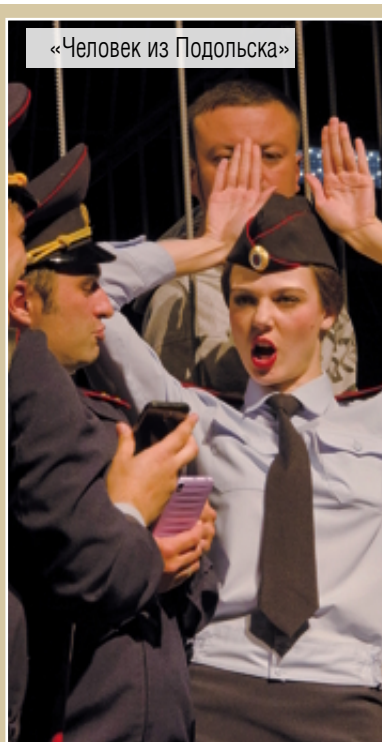
«Человек из Подольска»