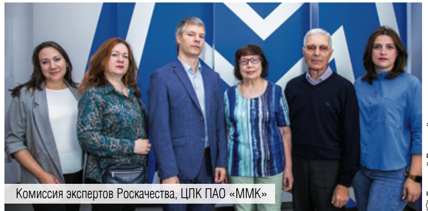
Комиссия экспертов Роскачества, ЦЛК ПАО «ММК»