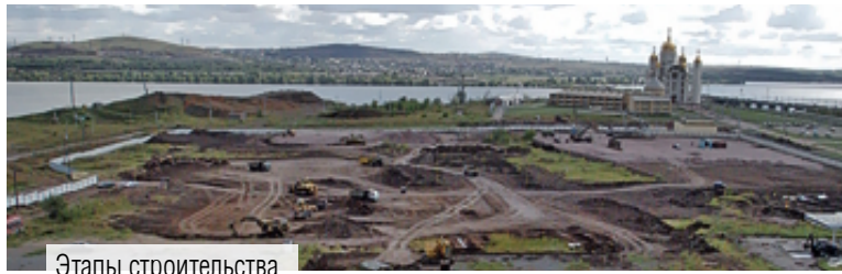
Этапы строительства Ледового дворца