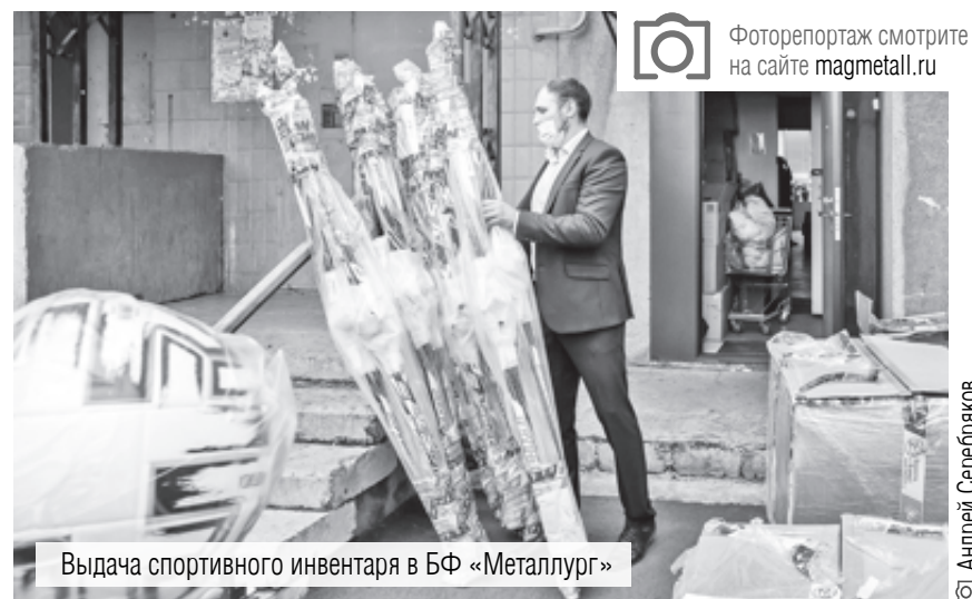
Выдача спортивного инвентаря в БФ «Металлург»

Фоторепортаж смотрите на сайте magmetall.ru